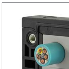
KET-ER по запросу могут поставляться с резьбовыми втулками.