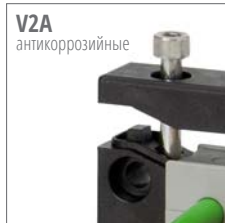
V2A антикоррозийные KET-ER могут поставляться с V2A (нерж. сталь) болтами.