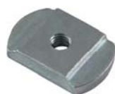
SC вставка одиночная для DIN рейки формы С (ПУ: 10) Заказ № 36220