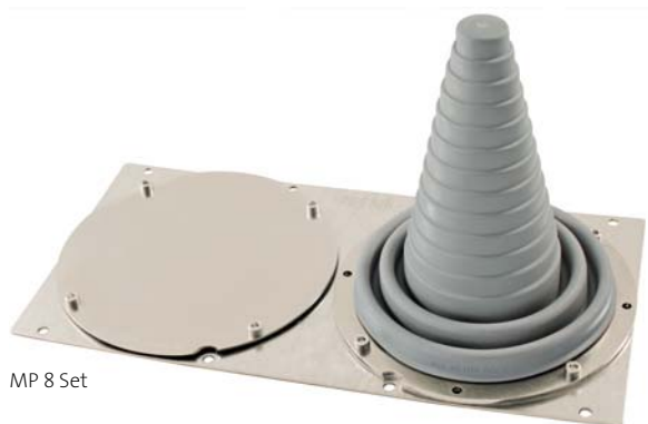
MP 8 Set