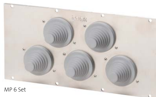
MP 6 Set