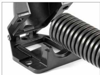
Зажим с канавкой для гофротрубки