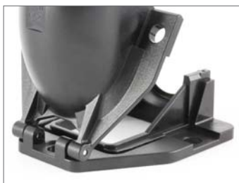
Фиксированная крышка на петлях