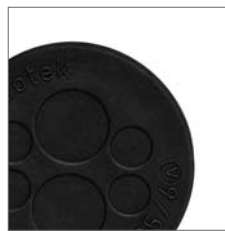
KEL-DP также доступны в черном цвете.