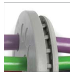
Панель ввода крепится к стенке шкафа при помощи ребра и выреза по периметру панели.