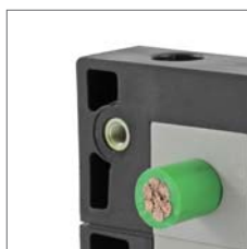
KEL-FG по запросу могут поставляться с резьбовыми втулками.