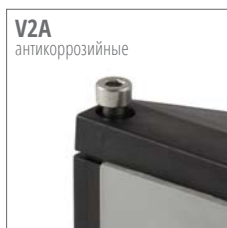
V2A антикоррозионные KEL-FG могут поставляться с V2A (нерж. сталь) болтами.